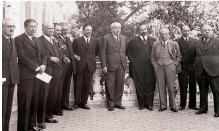
Cuarto gobierno republicano de Manuel Azaña, 1933.

Relacione esta imagen con el bienio reformista (1931-1933) en la Segunda República.