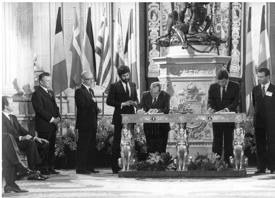
Firma del Tratado de Adhesión de España a la CEE. 12 de junio de 1985.

FUENTE HISTÓRICA: Relacione esta imagen con la integración de España en Europa