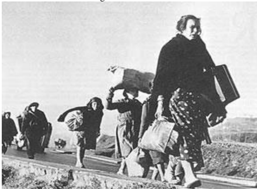
Fotografía de Robert Capa de un grupo de españoles camino del exilio a Francia.

FUENTE HISTÓRICA: Relacione esta fotografía con el exilio durante la dictadura franquista.