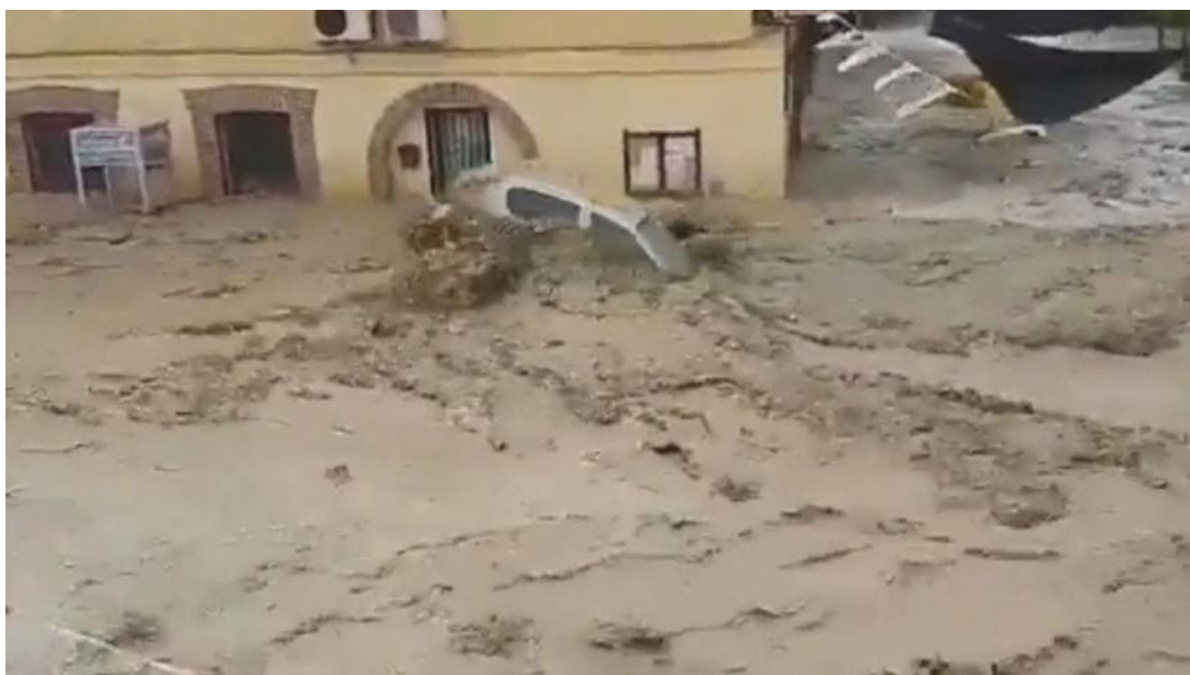
Figura 2. Desastre en Cebolla (Toledo).